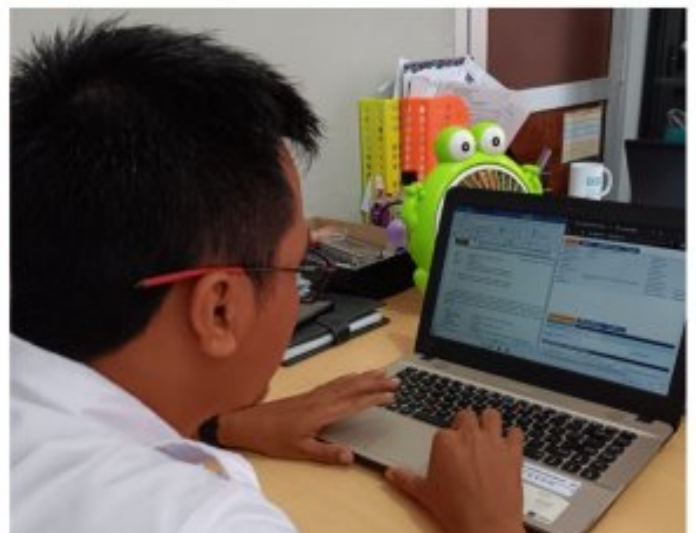
Optimalisasi Penggunaan SDP pada Balai Pemasyarakatan Kelas II Nusakambangan

Nusakambangan - SDP (Sistem Database Pemasyarakatan) adalah salah satu program unggulan berbasis teknologi informasi dari Dirjenpas (Direktorat Jenderal Pemasyarakatan) Kemenkumham RI yang berbentuk sistem mekanisme pengelolaan data warga binaan Pemasyarakatan (WBP) dan klien pemasyarakatan. SDP terus mendapatkan pembaruan untuk optimalisasi fitur-